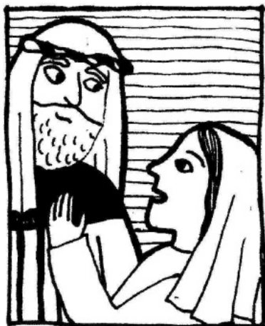
SOUDECE + VDOVA

jen dokáže pomoci těm, kdo o to žádají, pak Bůh zajisté učiní pro vás víc, když ho požádáte o pomoc, protože on vás miluje.“